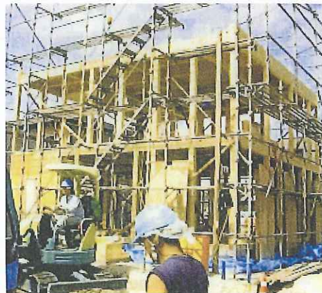
床にヒノキ厚物合板を貼った住宅施工