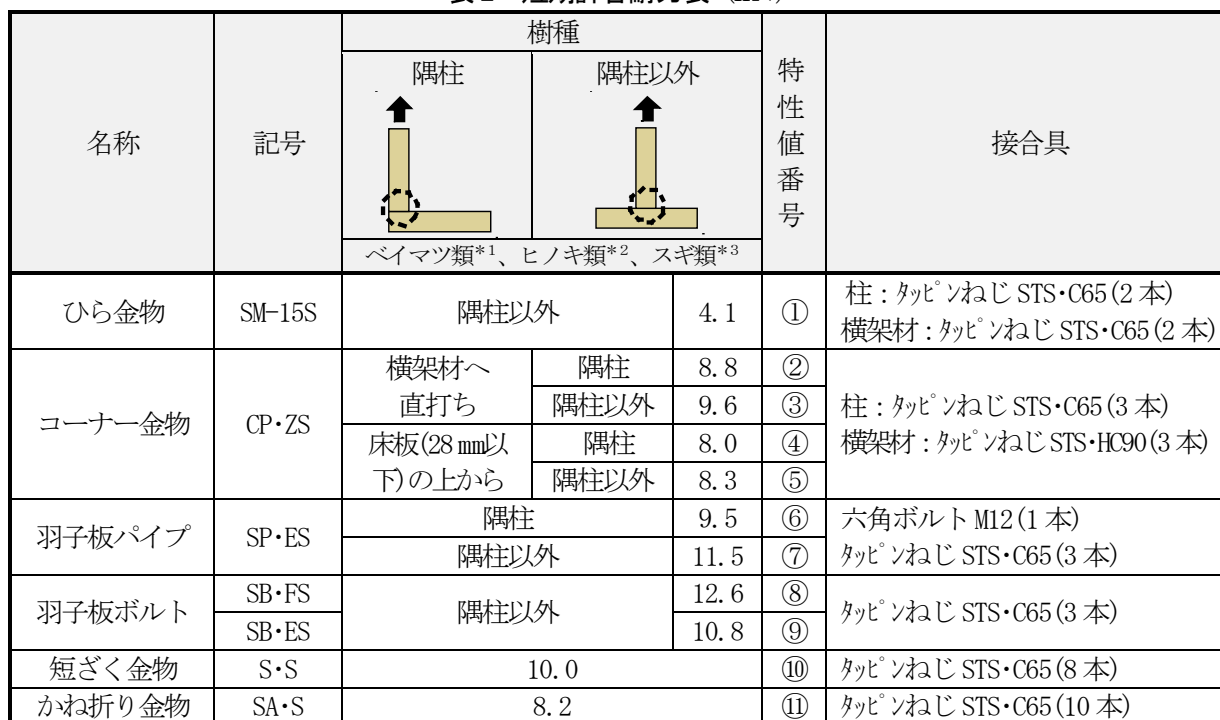
表2 短期許容耐力表 (kN)

(注1) 耐力の算出方法は、(公財)日本住宅・木材技術センター接合金物試験法規格及び(公財)日本住宅・木材技術センター発行「木造軸組工法住宅の許容応力度設計(2008年版)」による。