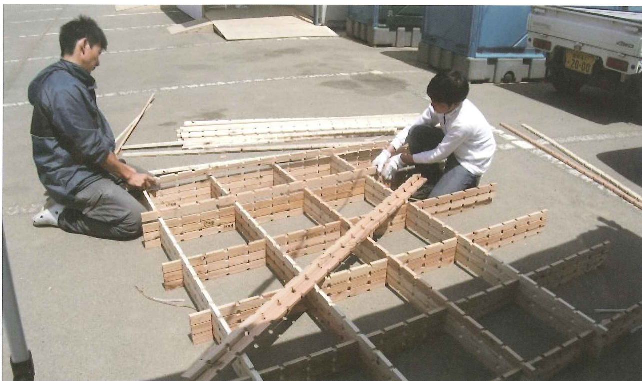
誰もが手軽に簡易な道具のみで組立可能