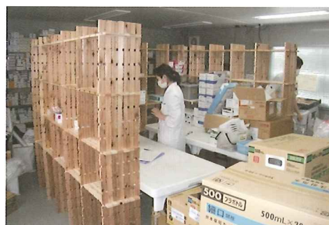
被災地に寄贈した組手什が薬品棚として利用される