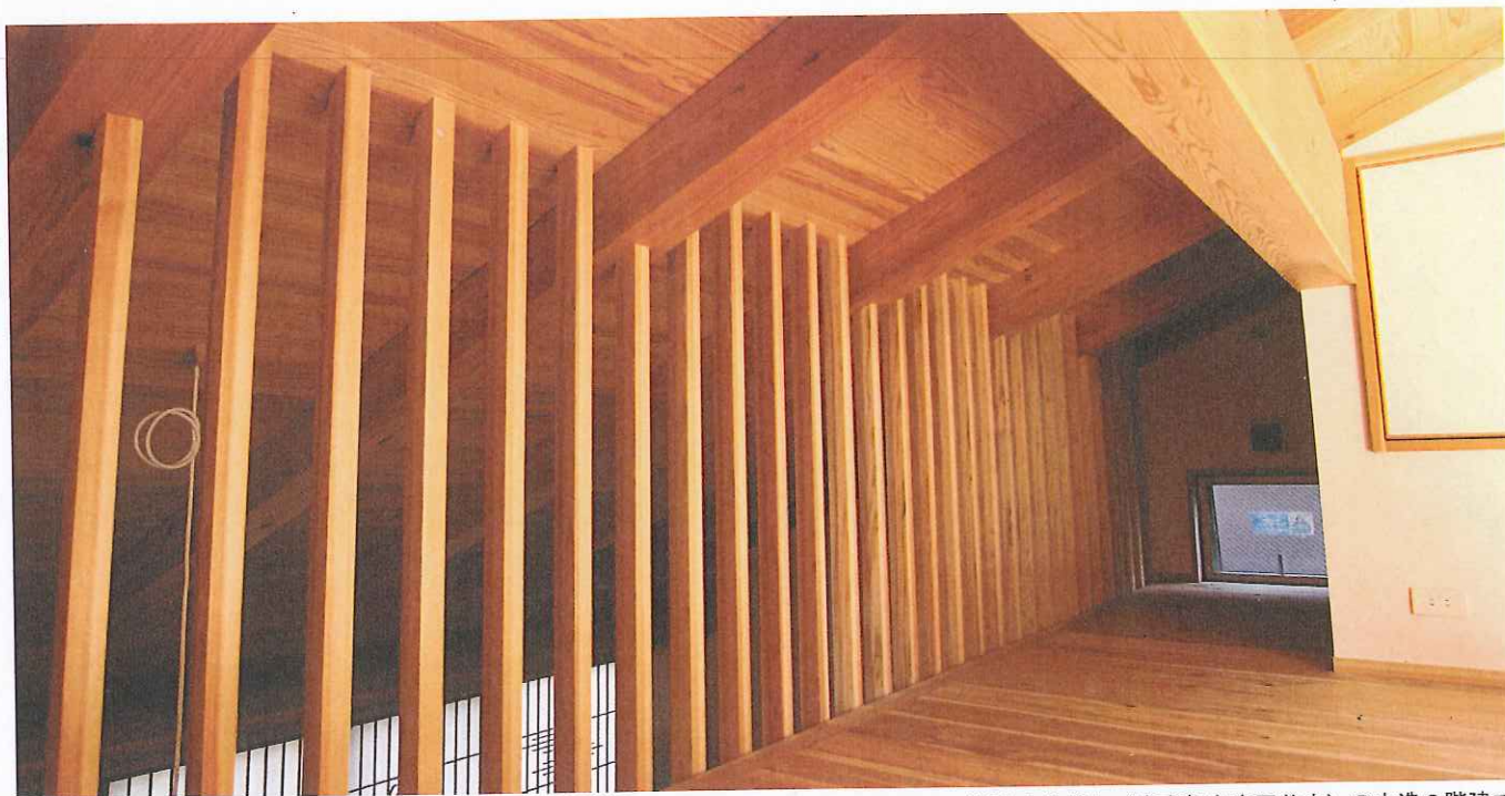
準防火地域内（東京都台東区谷中）の木造3階建て