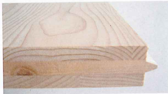
「Jパネル（国産材3層クロスパネル）」

従来、市街地の木造建築物は、外部(外壁)をモルタルや窯業系サイディング、内部をせっこうボード等で仕上げ、木材を覆うことが一般的でした。それは、壁や床などの部材に防火性能を持たせるためです。しかし、2000年の改正建築基準法施行後、壁や床などには、非損傷性、遮熱性、遮炎性が求められ、必ずしも燃えないもので造る必要はなく、燃え進み難いもので所定の性能を達成できるようになりました。今回の受賞において評価いただいた国土交通大臣認定の仕様は、木材(Jパネル)の燃え進み難い性質を有効に活用したもので、せっこうボードを使用しない外壁木材張りの防火構造や、特に木材があらわしとなった準耐火構造の実用化は木材の需要開拓に大きく貢献できます。その意味でも、この仕様が認知されれば、「木造や木材は火事に弱い」と思われている風潮に一石を投じることになり、市街地建築の木材利用及び活用のあり方を見直す契機と成り得ると考えられます。