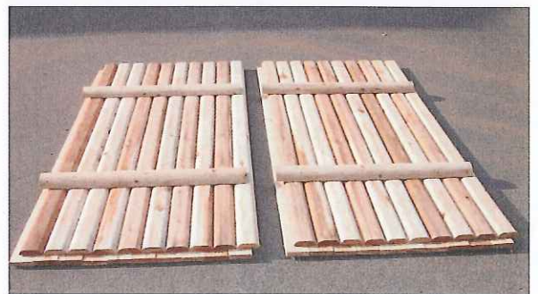
「残存型枠はめ込み式木製化粧パネル」単体写真