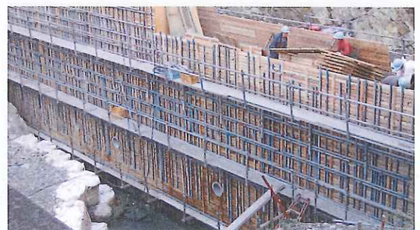
治山堰堤施工写真