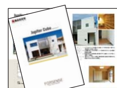
プレゼンボード等 (工務店にてアレンジ可)