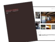
パンフレット (本部作成ツール)