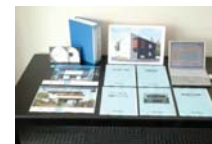
意匠設計マニュアル