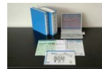
進捗管理システム