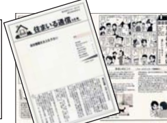
情報誌 (ニュースレター)