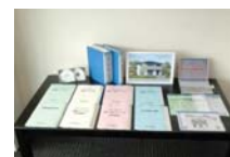
フォーセンスシステム