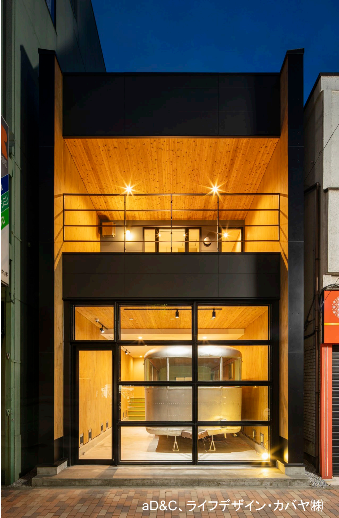
aD&C、ライフデザイン・カバヤ(株)