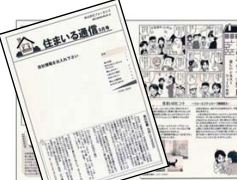
情報誌（ニュースレター）