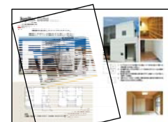
プレゼンボード等 (工務店にてアレンジ可)