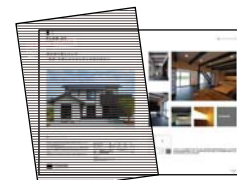
パンフレット (本部作成ツール)