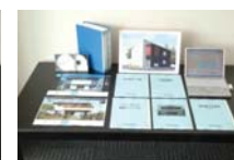
意匠設計マニュアル