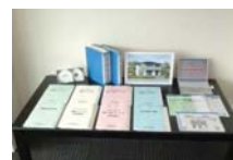
フォーセンスシステム