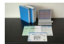
進捗管理システム